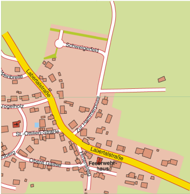
Ausschnitt, vgl. Straßenverzeichnis Hemau, K 18 – L 18