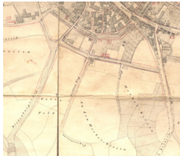
Stadtplan Hemau 1853/55, Ausschnitt „ Unterer Paintner-Steig “

Der Straßenname bezieht sich auf den nahegelegenen Ort Painten. Ein „ Paintner-Weg “ als Abzweigung des sog. „ Stadler(!) Weges “ sowie ein „ Unterer Paintner-Steig “ finden sich bereits auf den alten Karten und Stadtplänen. Ungeachtet der unterschiedlichen Schreibungen kann der „ Unterer Paintner-Steig “ in seinem Wegverlauf als unmittelbarer Vorläufer des heutigen „ Paintener Weges “ angesehen werden.