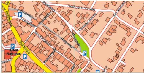
Ausschnitt, vgl. Straßenverzeichnis Hemau, H 6