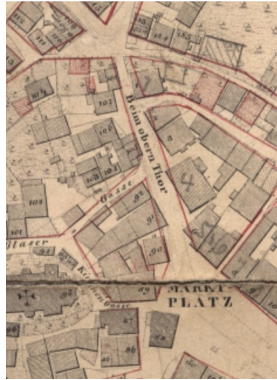
Stadtplan Hemau 1853/55, Ausschnitt „Beim obern Thor“

Im Uraufnahmeblatt der Stadt Hemau (1830/32) und auch später liest man für diesen Stadtteil noch die Bezeichnung „ Beim obern Thor “. Solche alten Namen orientieren sich häufig an den mittelalterlichen Mauern und Befestigungswerken einer Stadt mit ihren jeweiligen „ Thoren “ und Türmen; in Hemau gingen diese trotz mehrfacher Reparaturen im Laufe der Zeit zugrunde.