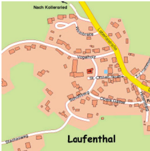
Ausschnitt, vgl. Straßenverzeichnis Hemau, K 19

vgl. auch Laufenthal, → Schloßberg; Hemau, → Oberer, → Unterer Stadtplatz; Neukirchen, → Obere, → Untere Hauptstraße