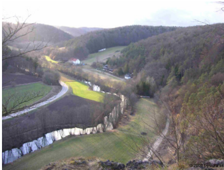
Luftbildaufnahme, o. J., „Jurakalksteinfelsen“

Die Straße führt in nördlicher Richtung zum Labertal mit seinen charakteristischen Jurakalksteinfelsen im Herzen der Oberpfalz in der östlichen Fränkischen Alb.