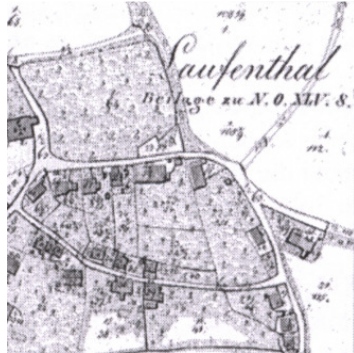
Ortsblatt Laufenthal 1830, Ausschnitt „Labertalstraße“ (ohne Benennung)

Die Straße führt in nördlicher Richtung zum Labertal mit seinen charakteristischen Jurakalksteinfelsen im Herzen der Oberpfalz in der östlichen Fränkischen Alb.