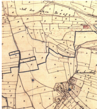
Uraufnahmeblatt Hohenschambach 1832, „Kochenthal“, Ausschnitt

Die Straße führt zu der nahe gelegenen Ortschaft Kochenthal; früher hieß die Straße im Volksmund noch „ Schwoiger-Gasse “, so benannt nach dem Anwesen namens „ Schwoigerhof “, dessen Existenz sich übrigens bis ins Jahr 1700 zurückverfolgen lässt.