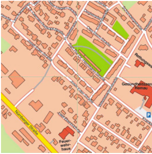
Ausschnitt, vgl. Straßenverzeichnis Hemau, D 3 - F 4

vgl. auch Hemau, → Josef-Ebenhöch-, → Josef-Schneider-Straße, → Spitalweg