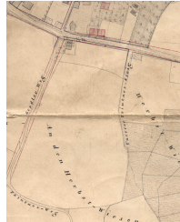
Stadtplan Hemau 1853/55, „ Stadler-Weg “, Ausschnitt

„ Der Stadlaer Weg wird in Dr.-Heim-Straße umbenannt “ (Stadtratsbeschluss 1965, Zitat)