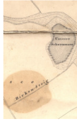
Stadtplan Hemau 1852/53, „Birken-Steig“, Ausschnitt

„Für die Straße, in der die „Tannenstraße“ endet, könnte eine weitere Baumart aufgenommen werden, da die angrenzenden Straßen ebenfalls nach Bäumen benannt sind. Bereits vergeben sind: Tannen-, Fichten-, Lärchen-, Birken-, Lindenstraße und Ulmenweg. Als neue Straßenbezeichnung werden folgende Namen vorgeschlagen: