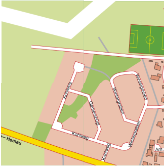
Ausschnitt, vgl. Straßenverzeichnis Hemau, G 13 – H 13